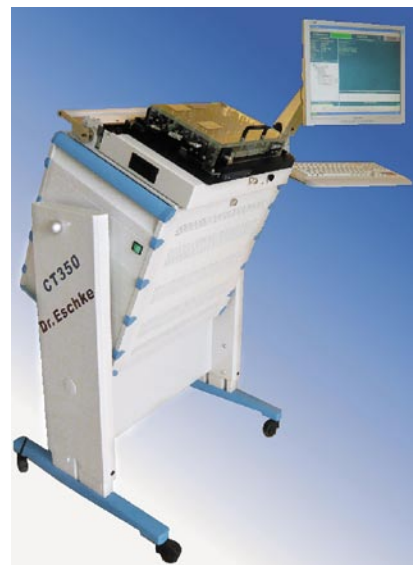
Abb. 2: CT350 Comet in Lobenstein