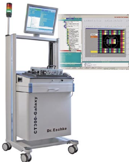
Abb. 1: CT300 Galaxy mit LCD-Testbild

Der Kooperationspartner RSG Elotech produziert als selbständiges Unternehmen einen Großteil der Flachbaugruppen für die Wachendorff GmbH. Die