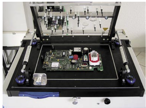
Abb. 4: Adapter mit Testobjekt

Entscheidender Faktor für die Setup-Zeiten ist der Adapterwechsel. Da alle Systeme mit einem Vakuumadapter-Grundgerät (High Pin Count Interface) ausgerüstet sind, lassen sich die Vakuumadapter ( Abb. 4 ) mit der 720poligen Schnittstelle leicht verriegeln – und auch ebenso schnell wieder entriegeln und wechseln. Via Barcode stellt der Tester sofort das Prüfprogramm zur Verfügung. Mit maximal 320 mm Breite und 220 mm Länge deckt die verfügbare Produktfläche nahezu 98 % der bei RSG gefertigten Formate an Baugruppen ab